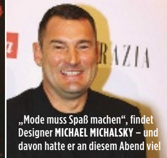
„Mode muss Spaß machen“, findet Designer MICHAEL MICHALSKY – und davon hatte er an diesem Abend viel