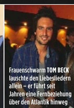
Frauenschwarm TOM BECK lauschte den Liebesliedern allein – er führt seit Jahren eine Fernbeziehung über den Atlantik hinweg