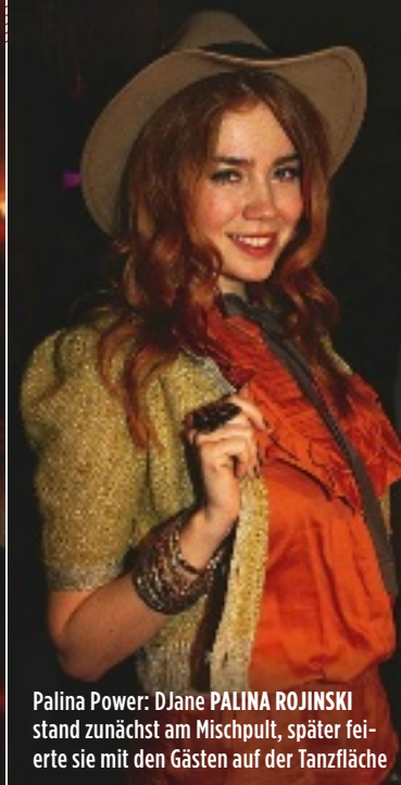
Palina Power: DJane PALINA ROJINSKI stand zunächst am Mischpult, später feierte sie mit den Gästen auf der Tanzfläche